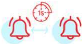
График «звонков» с шагом в 15 минут. Питание будет в несколько смен

Гибкий график обеденного зала для каждой параллели классов